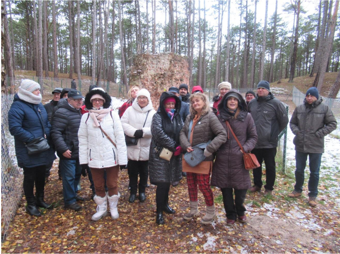
Zdjęcie nr 3 – Ruiny kościoła św. Mikołaja.