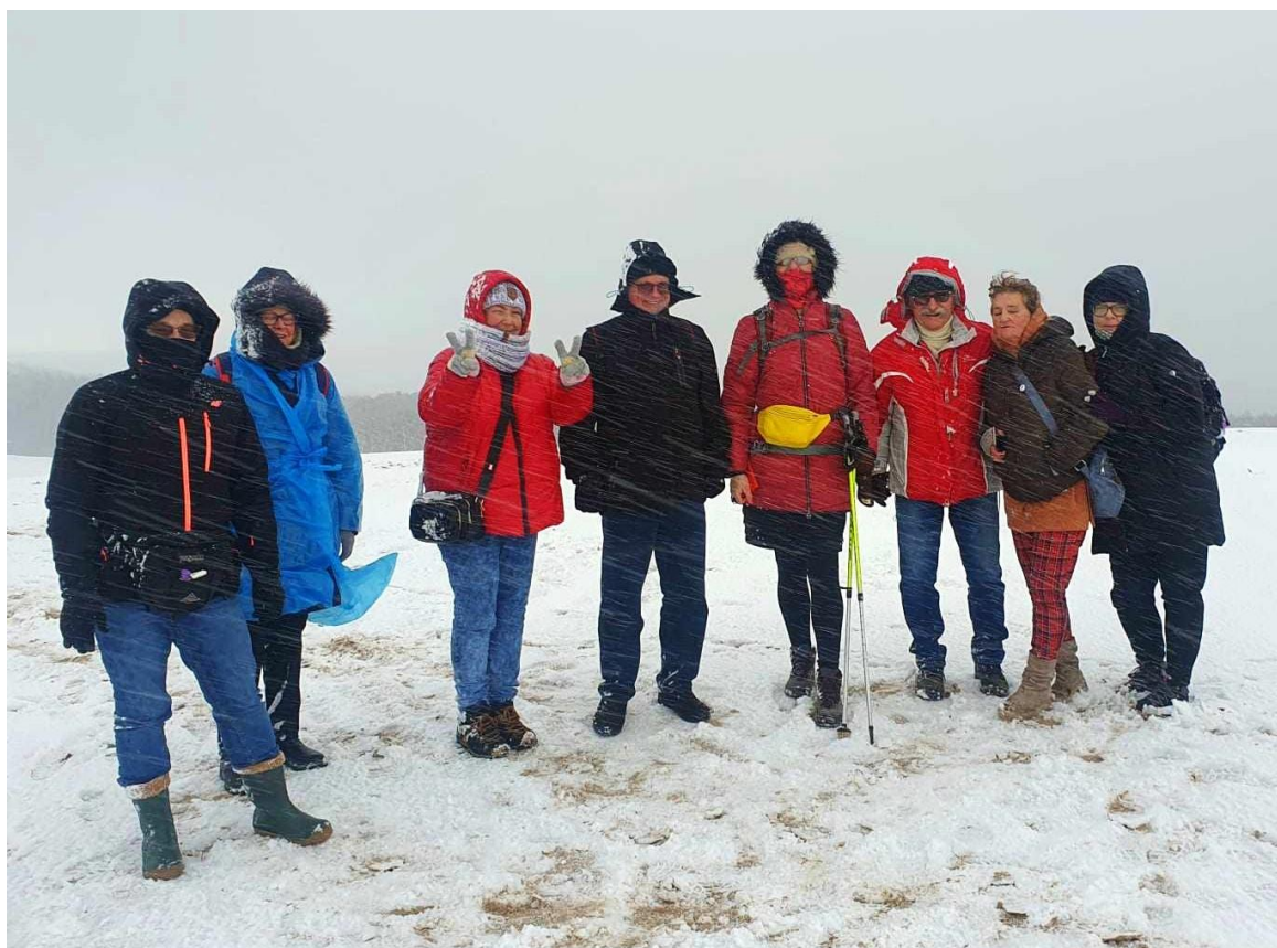
Zdjęcie nr 2 – Na szczycie Wydmy Łąckiej.