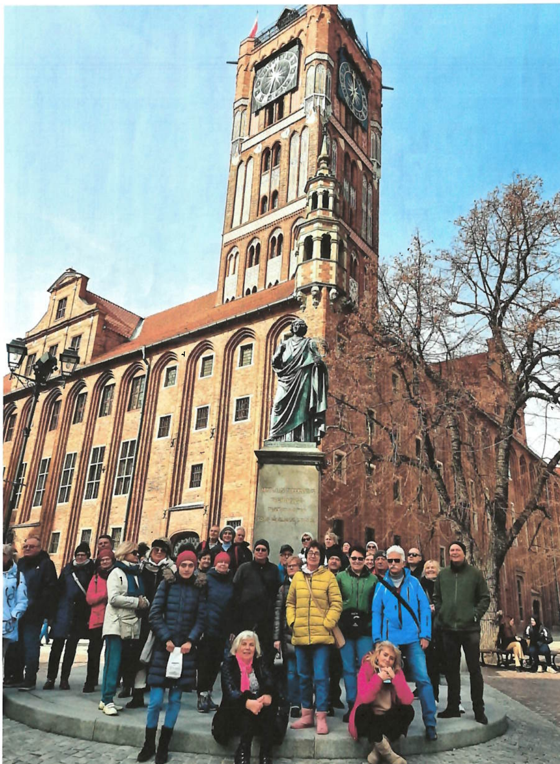
Zdjęcie nr 5 – Pomnik Mikołaja Kopernika – odsłonięty w 1853 r. Jest drugim pod względem wieku zachowanym pomnikiem w Polsce.