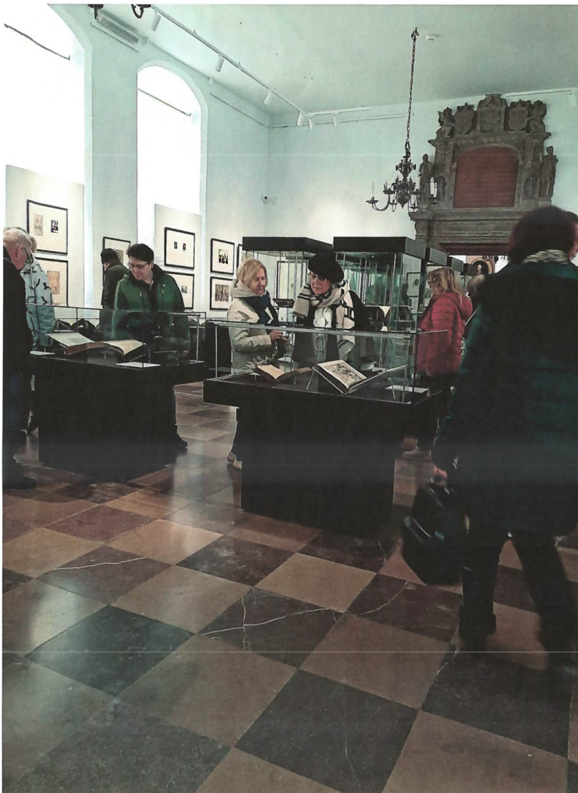
Zdjęcie nr 8 – Muzeum Okręgowe – wystawa czasowa poświęcona dziełu Mikołaja Kopernika „De revolutionibus orbium coelestium”.