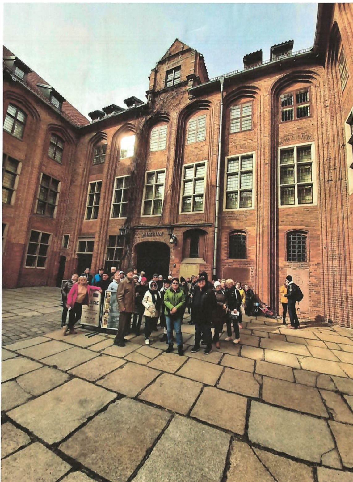
Zdjęcie nr 7 – Muzeum Okręgowe z siedzibą w gotyckim Ratuszu Staromiejskim.