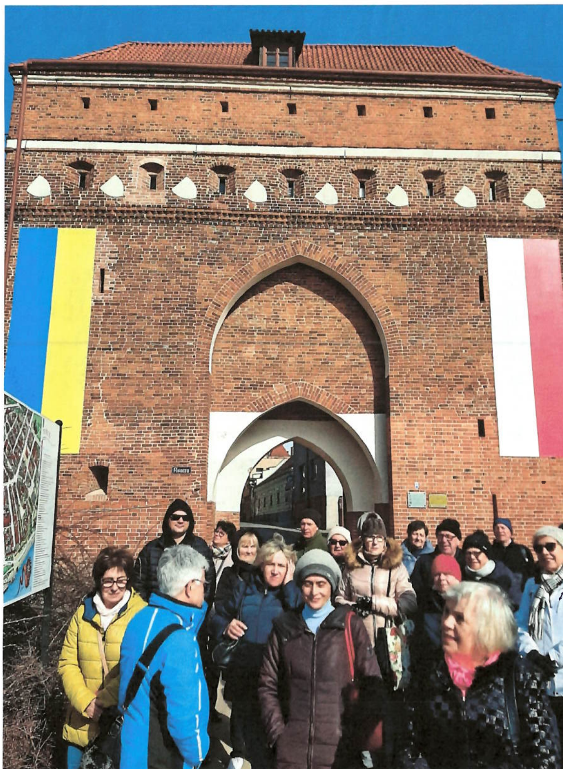
Zdjęcie nr 2 – Brama Klasztorna także Brama Świętego Ducha lub Brama Panieńska jedna z trzech bram średniowiecznych Torunia jakie przetrwały do dzisiaj.