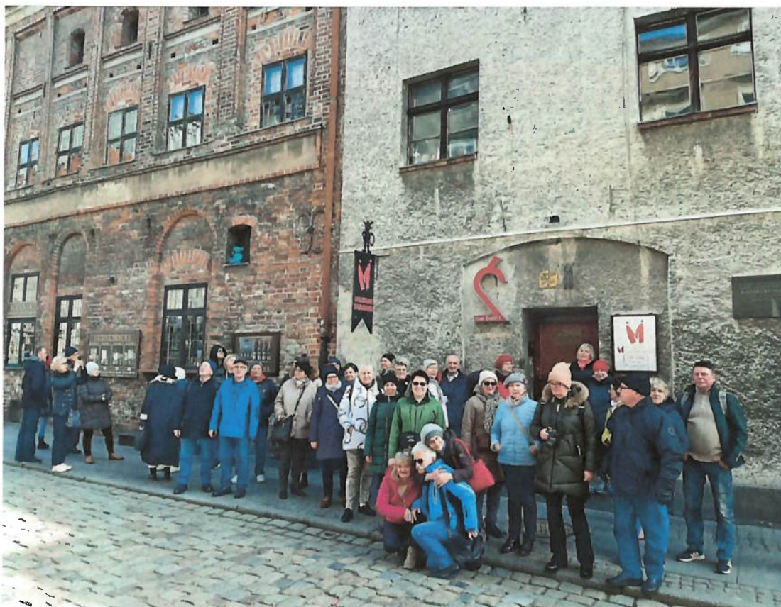
Zdjęcie nr 3 – Muzeum Zabawek i Bajek w zachodniej części Zespołu Staromiejskiego.