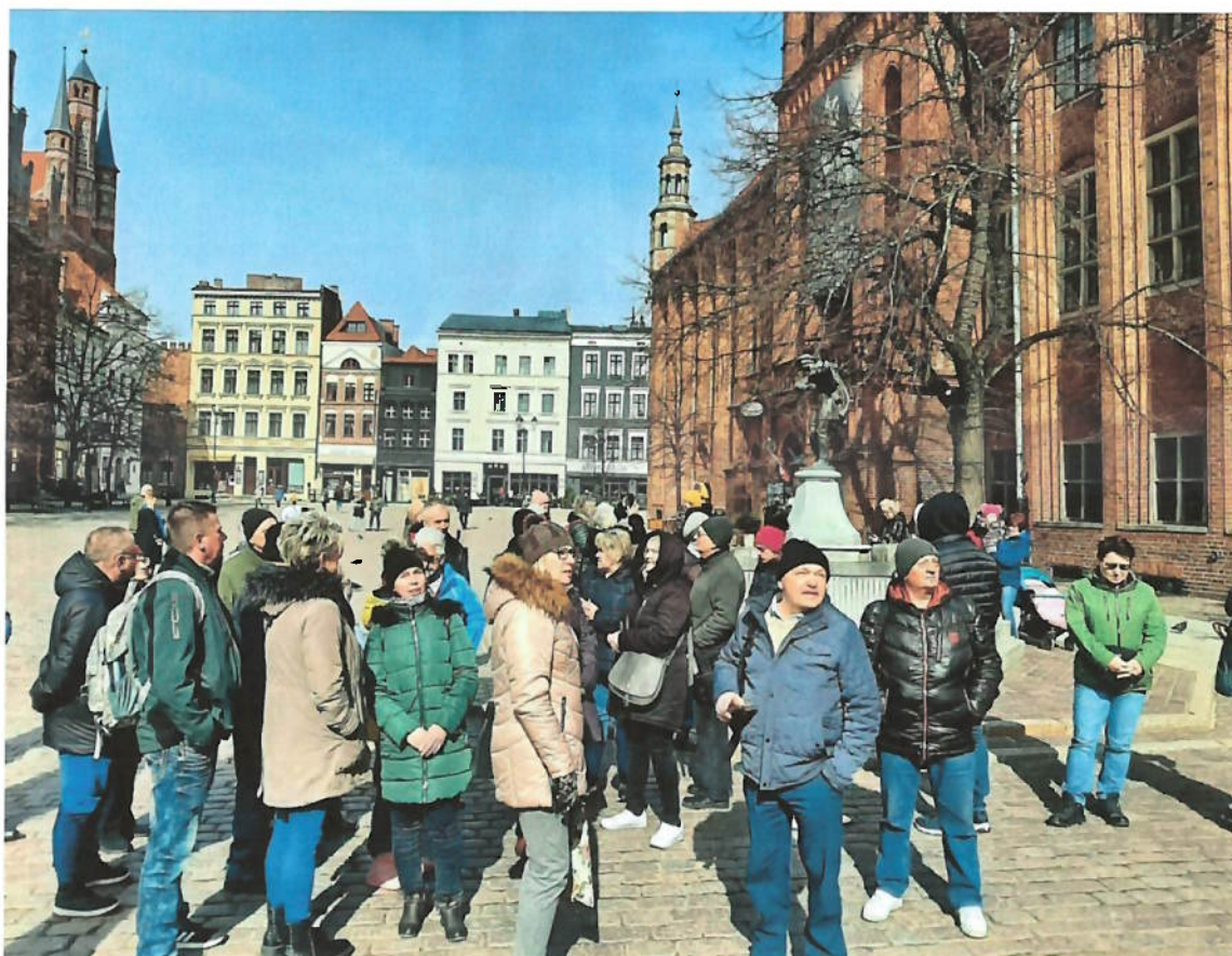
Zdjęcie nr 6 – Fontanna flisaka w Toruniu – zwieńczona statuetką flisaka grającego na skrzypcach.