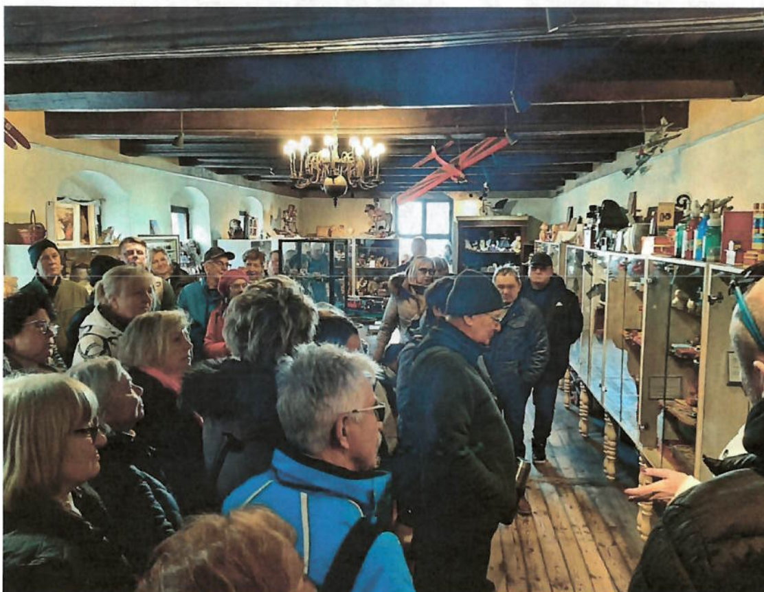
Zdjęcie nr 4 – Muzeum Zabawek i Bajek – w środku.