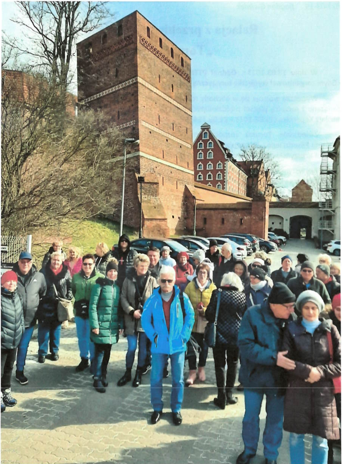
Zdjęcie nr 1 – Krzywa wieża w Toruniu – średniowieczna baszta miejska.